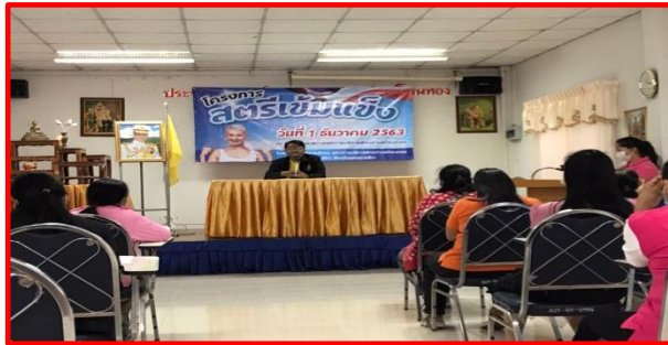
ประมวลภาพโครงการสตรีเข้มแข็ง วันที่ ๑ ธันวาคม ๒๕๖๓