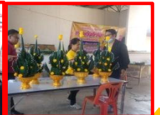
ประมวลภาพประชุมสภาองค์การบริหารส่วนตำบลโพธิ์ทอง สมัยสามัญ สมัยที่ ๔ ครั้งที่ ๑/๒๕๖๓ วันที่ ๑๔ ธันวาคม ๒๕๖๓