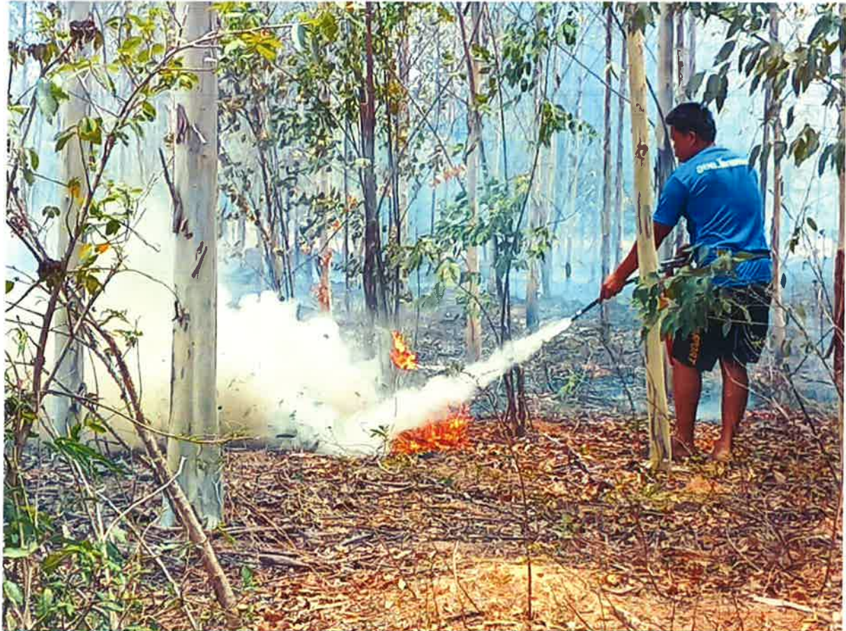
เข้าระงับกรณีเกิดเหตุไฟลามทุ่งบริเวณในเขตชุมชนร่วมกับตำบลข้างเคียง